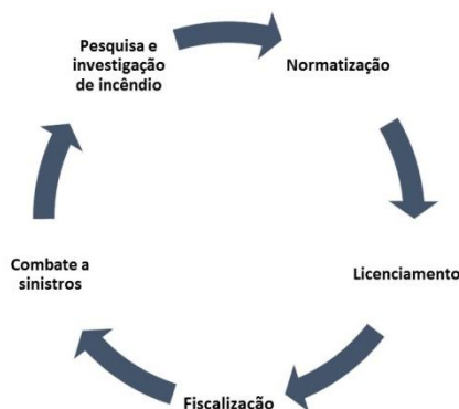
Imagem 01 – Ciclo de Segurança Contra Incêndio

fiscalização, combate a sinistros e investigação de incêndio, compondo um ciclo racional e completo, no qual as ações se retroalimentam, como demonstra a Imagem 01: